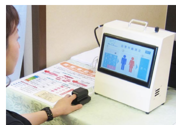
血管年齢チェック