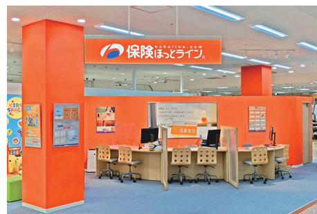
※画像は既存店舗の写真です

地下鉄空港線「天神」駅から徒歩約3分、西鉄天神大牟田線「西鉄福岡(天神)」駅から徒歩約5分