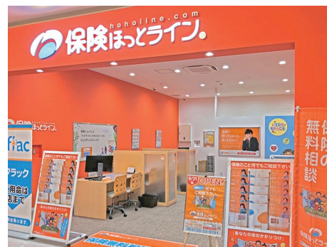
※画像は既存店舗の写真です

国道 153 号線「梅森西」交差点より県道 221 号線を北東へ約 1km、平和堂日進香久山店内